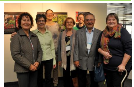
Lancement de l'exposition Jardin de chez nous lors de la Journée des aînés du 2 octobre